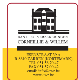
ontwerp met aflopend geel vlak