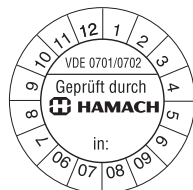
ijk- en keursticker