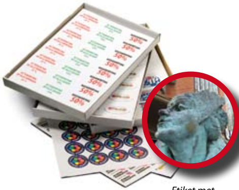
Etiket met alleen foto