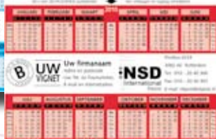
Model B: Indrukrimte 150 x 29 mm