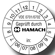
ijk- en keursticker