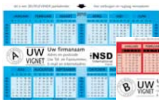
Model A: Indrukrimte 113 x 13 mm