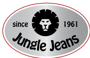
ontwerp met smalle witrand rondom sticker

Maakt u een ontwerp met bedrukking tot aan de rand van het etiket, (zie voorbeeld hiernaast) zorgt u er dan voor dat in het ontwerp de kleurvlakken tot voorbij de rand van de sticker lopen: 2-3 mm